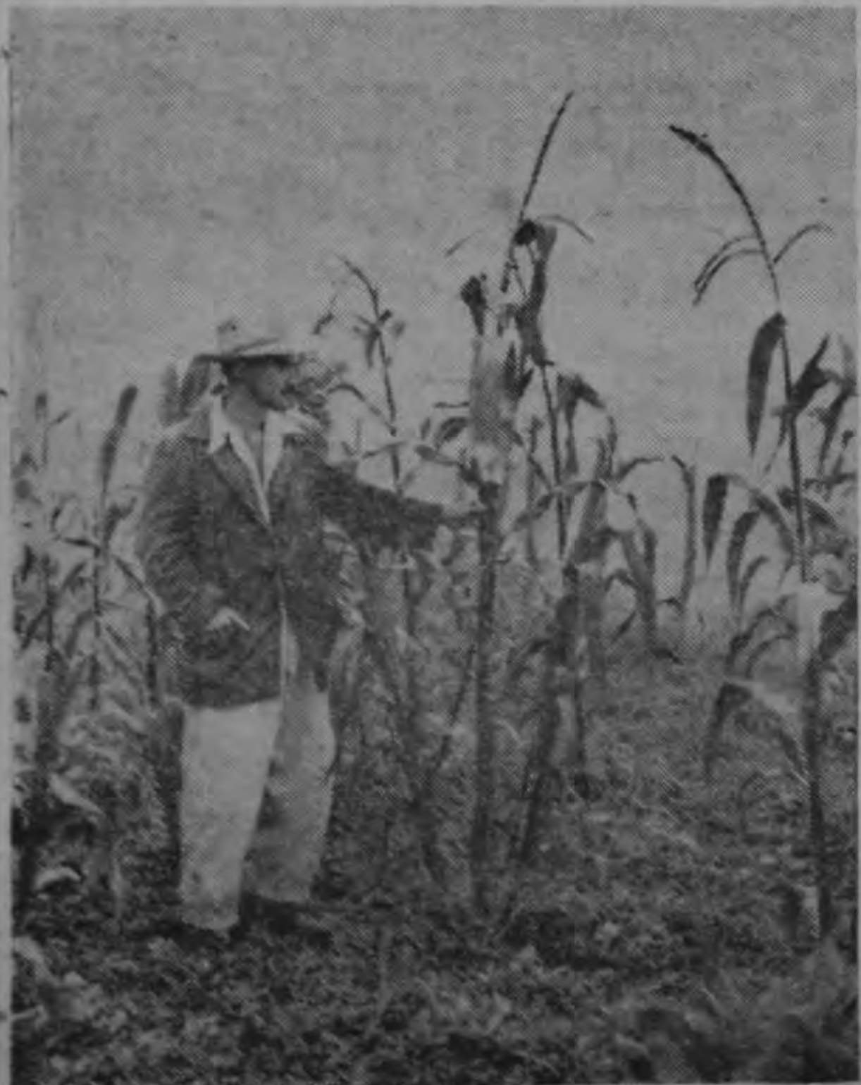
Planta polinizada artificialmente. Nótese el fuerte desarrollo y floración temprana a los 2 meses de edad.

Es de gran conveniencia particular y nacional que los productores de caña comprueben la bondad de estas variedades.