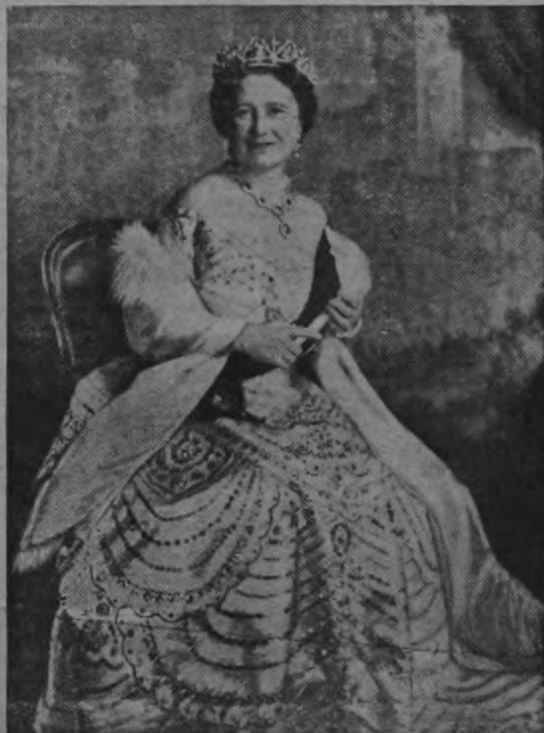
La Reina Madre Isabel, que se encuentra en Rhodesia del Sur con su hija Margarita, para realzar la inauguración de la Exposición del Centenario de Cecil Rhodes.