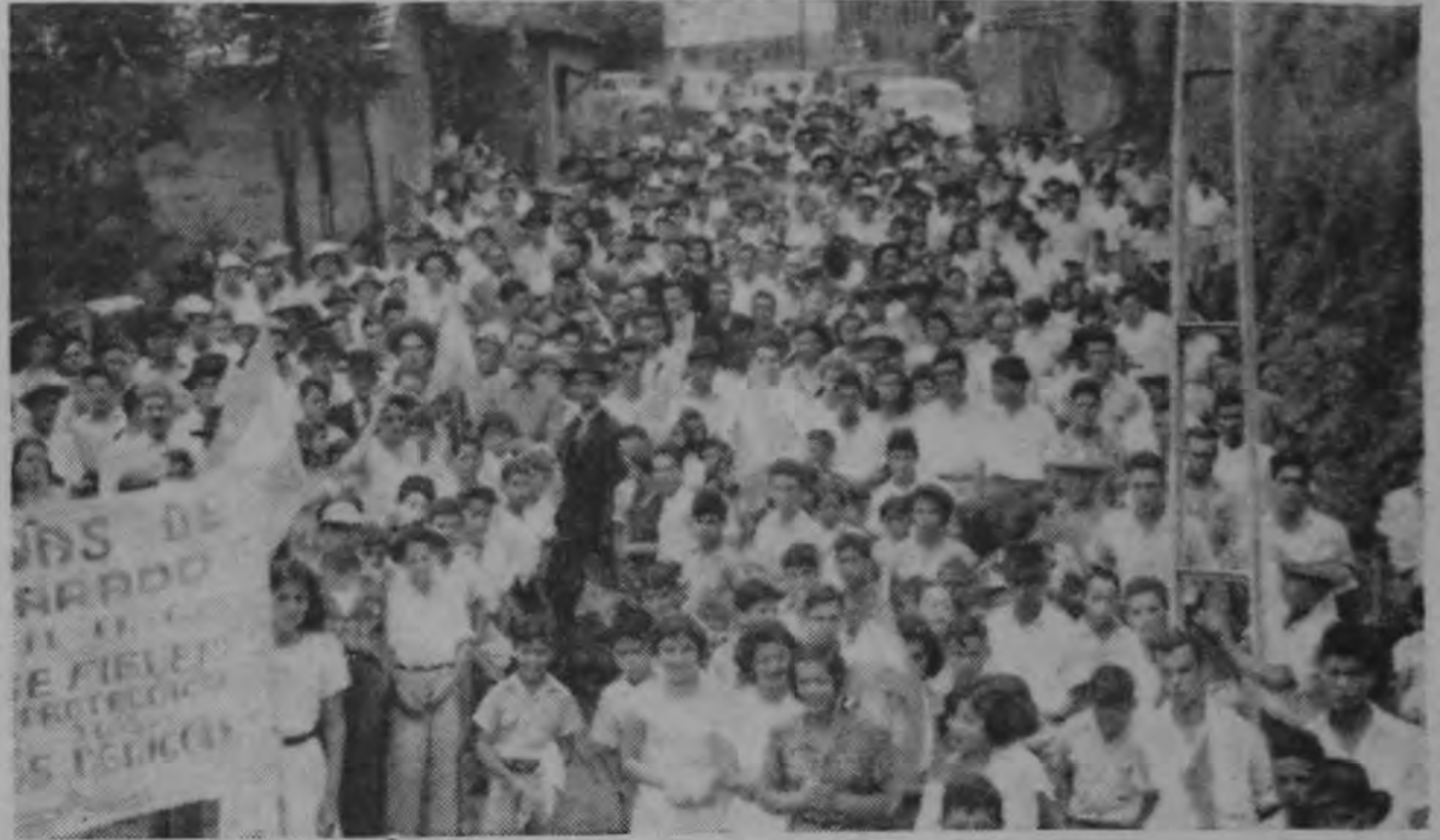
RECIBIMIENTO EN PACAYAS

Antes, en las visitas a los pueblos, los políticos recibían solicitudes de cosas inmediatas, pequeñas; hoy las peticiones son más amplias, son de carácter económico quieren producir más, quieren producir mejor, quieren educación para sus hijos, quieren mejoras sanitarias, quieren mejores condiciones de vida; hablan de la falta de regulación de precios, de abusos, del Consejo de la Producción; quieren, en una palabra, que cultivar la tierra sea un medio útil de vida y no sea, como hasta hoy, un mantenimiento de estado de miseria.