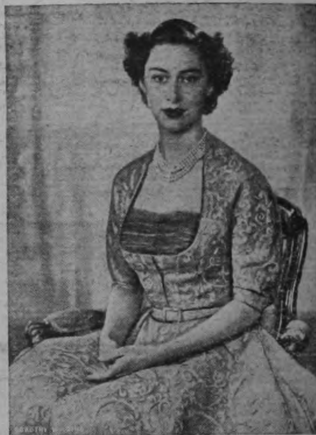
Princesa Margarita de Inglaterra, de visita en Rhodesia del Sur en compañía de la Reina Madre Isabel, para asistir a la Exposición del Centenario de Cecil Rhodes, inaugurada ayer en Bulawayo.