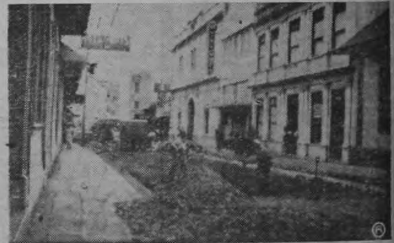
Rápidamente se están realizando los trabajos de pavimentación en la Avenida Tercera, entre el Correo Central y la Imprenta Nacional. El armazón de hierro de la nueva pista asegura su duración.

Es lógico que esta vez el Presidente Eisenhower y su Secretario de Estado deben insistir en que la política económica norteamericana sirva a nuestros intereses diplomáticos; ya que si perdemos esta oportunidad en Bolivia, arriesgamos a que no se presente otra.